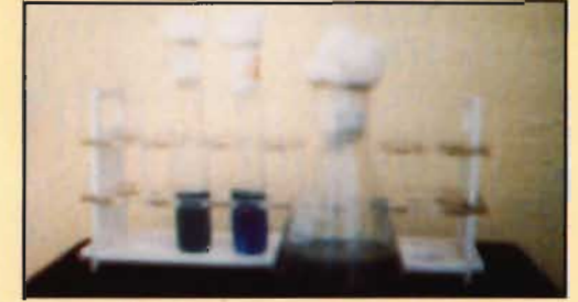
चित्र - 4 : एजोस्पाइरिलम कल्चर

यह जीवाणु खाद स्वतंत्र जीवी नत्रजन स्थिरीकरण एजोटोबैक्टर या एजोस्पाइरिलम जीवाणु की एक नम चूर्ण रूप उत्पाद है। इसके एक ग्राम भाग में लगभग 10 करोड़ जीवाणु होते हैं। यह जीवाणु खाद किसी भी प्रजाति जो लेग्युम या अन्य प्रजाति के पौधों में उपयोगी हैं (चित्र-4)।