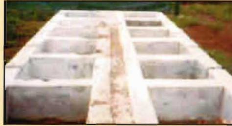
चित्र - 3 : वैम कल्चर तैयार करने हेतु सीमेंट की बेंड (1 ग 1 ग 0.75) मीटर

वैम का कल्चर कुछ ट्रेप पौधों जैसे गेंदा, मक्का व घास (पोनीकम मैक्सीमम, पैनीसेटम, पैडीसिलेटम) की जड़ों में तैयार किया जाता है (चित्र-3)। जड़ों के छोटे-छोटे टुकड़े व मिट्टी (लगभग 500 ग्राम) पौलिथीन पैकेट में भरकर उन्हें संरोपण के लिये भेजा जाता है। राइजोबियम व अन्य बैक्टीरिया को आसानी से कृत्रिम साधन (मीडिया) में उगाकर, लिग्नाइट में मिलाकर 250 ग्राम पौलिथीन थैली में भरकर संरोपण के लिये भेजी जाती है।