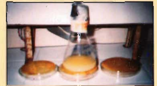
चित्र - 5 : पी.एस.बी. कल्चर

नाइट्रोजन के बाद फास्फोरस पौधों के लिये अति आवश्यक तत्व है। इसकी पूर्ति के लिये रासायनिक खाद जैसे सूपर फास्फेट अथवा राक फास्फेट के रूप में किया जाता है। किन्तु ये रासायनिक खाद वांछनी प्रजातियों में नर्सरी अथवा वृक्षारोपण में डालने के कुछ ही समय पश्चात् अधुलनशील रूप में परिवर्तित हो जाती है। पौधे सिर्फ घुलनशील रूप में फास्फेट ग्रहण करते हैं। फास्फेट, पी.एस.बी कल्चर में उपस्थित जीवाणु अधुलनशील फास्फेट को अपनी जैविक प्रक्रिया के दौरान घुलनशील रूप में बदल देते हैं। यह फास्फोरस पौधे तुरंत ग्रहण करने में सक्षम हो जाते हैं तथा इस प्रकार जीवाणु फास्फोरस तत्व की मिट्टी में उर्वरकता बढ़ाते हैं (चित्र-5)।