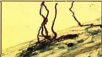
चित्र - 2 : वैम कवक के तन्तु पोषक जड़ों से लगे हुए, इन्हीं के द्वारा पोषक तत्व पौधों को प्राप्त होते हैं।

आदि वातावरण से नाइट्रोजन लेकर पौधों में स्थिरीकरण करते हैं तथा मिट्टी में स्थित न घुलने वाली फास्फोरस को घुलनशील बनाकर पौधों को उपलब्ध कराने की क्षमता रखते हैं। बहुत से बैक्टीरिया जो माईकोराईजा तथा पौधों में मूलग्रंथि बैक्टीरिया बढ़ाने में मदद करते हैं, माईकोराईजा सहायक व मूलग्रंथि सहायक बैक्टीरिया कहलाते हैं।