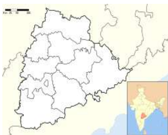
categories Fig. 1: Explicit Study area Mahabubnagar District of Telangana State, India.

In tropical rainy type, the mean daily temperature is above 20° C with an annual rainfall of 150 to 200 cms, mostly in summer and South-West monsoon. In the Hot Steppe type, the mean daily temperature is 18° C and less. In the state of Telangana Maximum temperature in the summer season varies between 37° C and 44° C and minimum temperature in the winter season ranging between 14° C and 19° C. The state has a wide variety of soils and they form into three broad