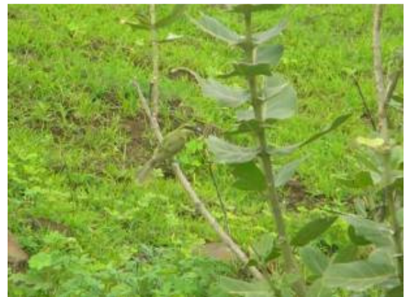
ग्रीन बी इटर