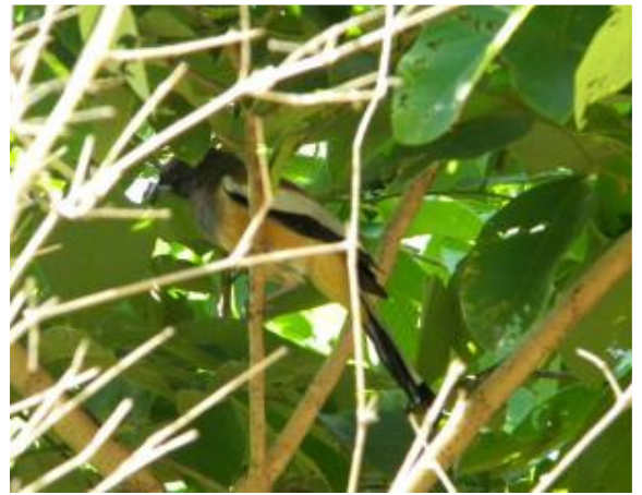
रुफस ट्री पाई