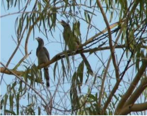
भारतीय ग्रे हार्नबिल