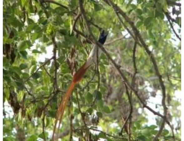
एशियन पॅराडाईज फलाईकेचर (दूधराज)