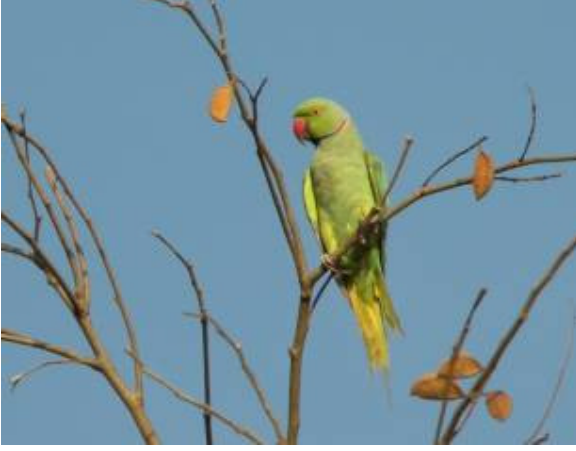
रोज रिंग परीट (तोता)

उष्ण कटिबंधीय वन अनुसंधान संस्थान, परिसर में पाये गये पक्षियों की कुछ प्रजातियाँ