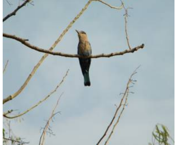
भारतीय रोलर (निलकंठ)