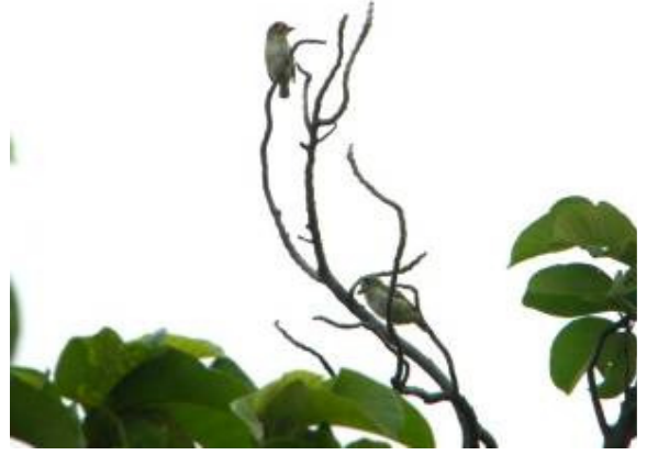
कॉपरस्मिथ बारबेट (बंसत)