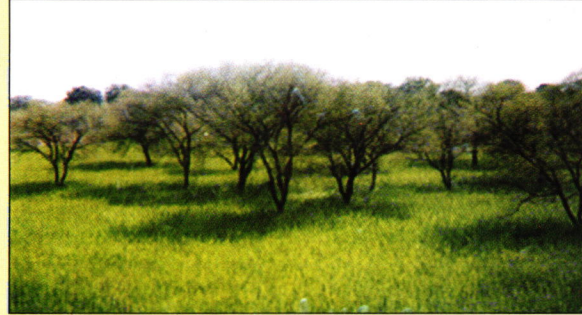
A view of Babul-Paddy system at OSR Barha (Jabalpur)