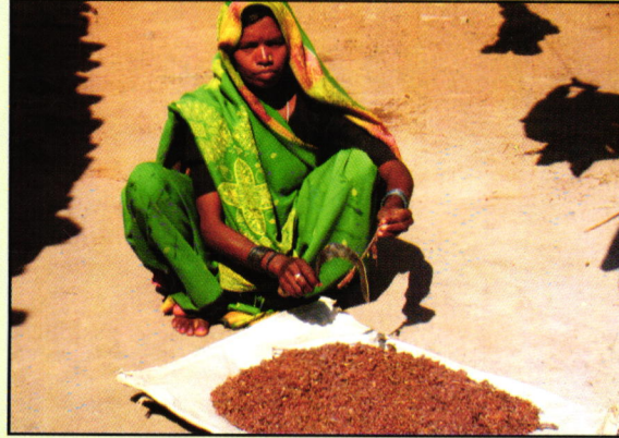
तूरीच्या फांदया पासून लाख काढणे.